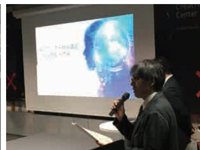
開会の挨拶でセミナーは始まった