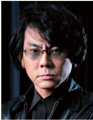
大阪大学基礎工学研究科荣誉教授 ATR 石黒浩特別研究所客員所長