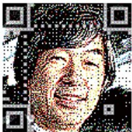
札幌市立大学学長

1959年東京生まれ。その後北に流れてつくば経由で現在は函館在住。一つのテーマに留まらないことをモットーにしている。AIの中でも他の人が手を出さない研究テーマが好きで将棋、囲碁、サッカー（ロボカップ）、小説生成などに手を出してきた。現在は人狼、カーリング、俳句生成などに手を出しつつある。一方で最近ではAIの社会実装にも興味を持ち、交通、漁業、画像認識などの応用に関わっている。常に新しい研究テーマを模索中。