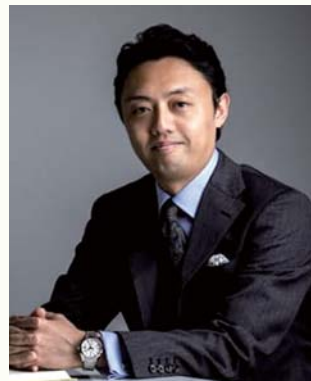
東京大学 大学院工学系研究科 教授

1952年西宮生まれ。関西弁と関東弁のバイリンガル。その後東へ北へと流れて現在は札幌市在住。学生時代からAIの研究を40年以上続けている。最近ではデザイン学やサービス学にも色気を出しているが、特に次世代のモビリティ・サービスの実装に意欲を持っている。インターネットのモビリティ版となるようなプラットフォームを構築することを目指しているが、その一部は札幌で実現の予定。人だけではなく雪やゴミを効率よく運びたい。