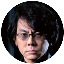
大阪大学基礎工学研究科荣誉教授 ATR 石黒浩特別研究所客員所長