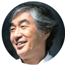
札幌市立大学学長