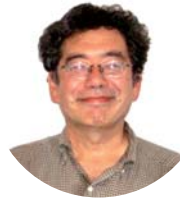
公立ほこだて未来大学副理事長・教授 (株)未来シェア代表取締役社長